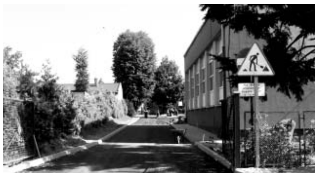
Droga wewnętrzna w ZS w Laskach

KĘPNO Remonty w placówkach oświatowych na terenie miasta i gminy