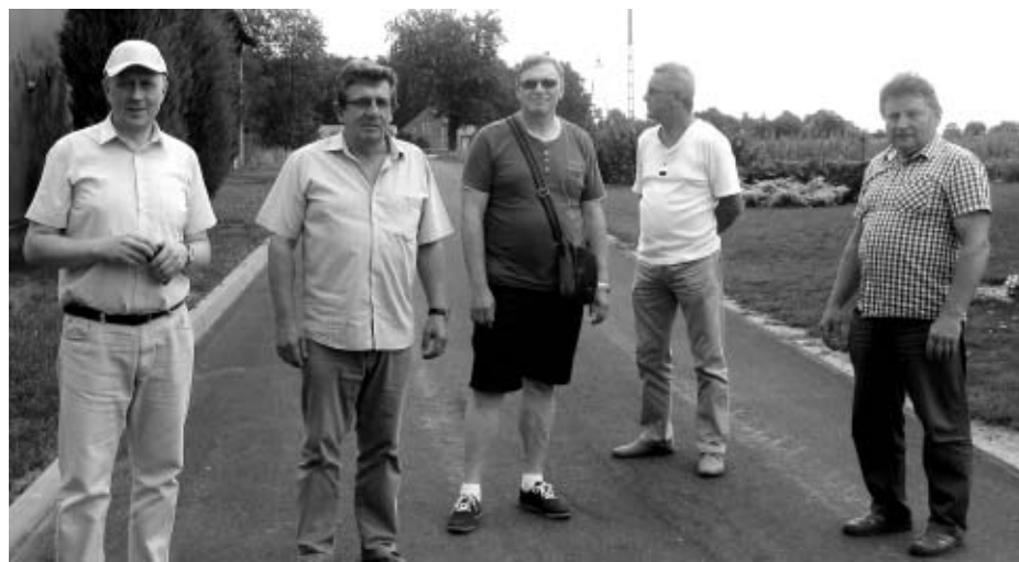
Droga w miejscowości Dzierżążnik

W Gminie Trzcinica odbył się odbiór wybudowanych i wyremontowanych w bieżącym roku dróg. Tego rodzaju inwestycje realizowane były we wszystkich sołectwach na terenie gminy.