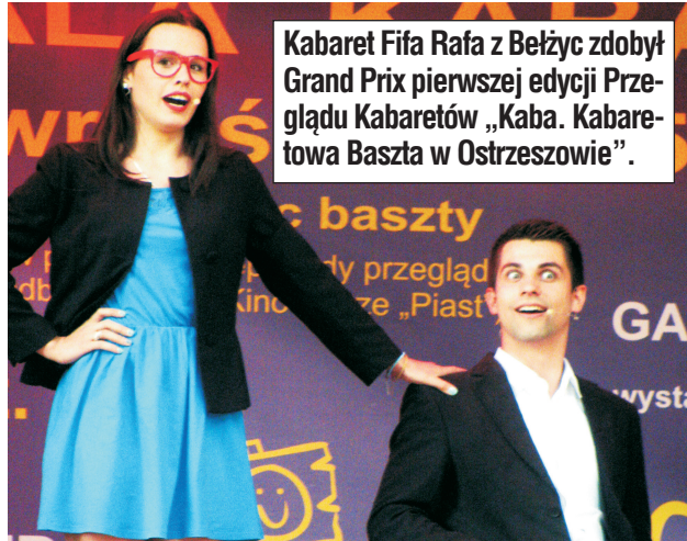
Kabaret Fifa Rafa z Bełzyc zdobył Grand Prix pierwszej edycji Przeglądu Kabaretów „Kaba. Kabaretowa Baszta w Ostrzeszowie”.

Przeglądu Kabaretów „Kaba. Kabaretowa Baszta w Ostrzeszowie”