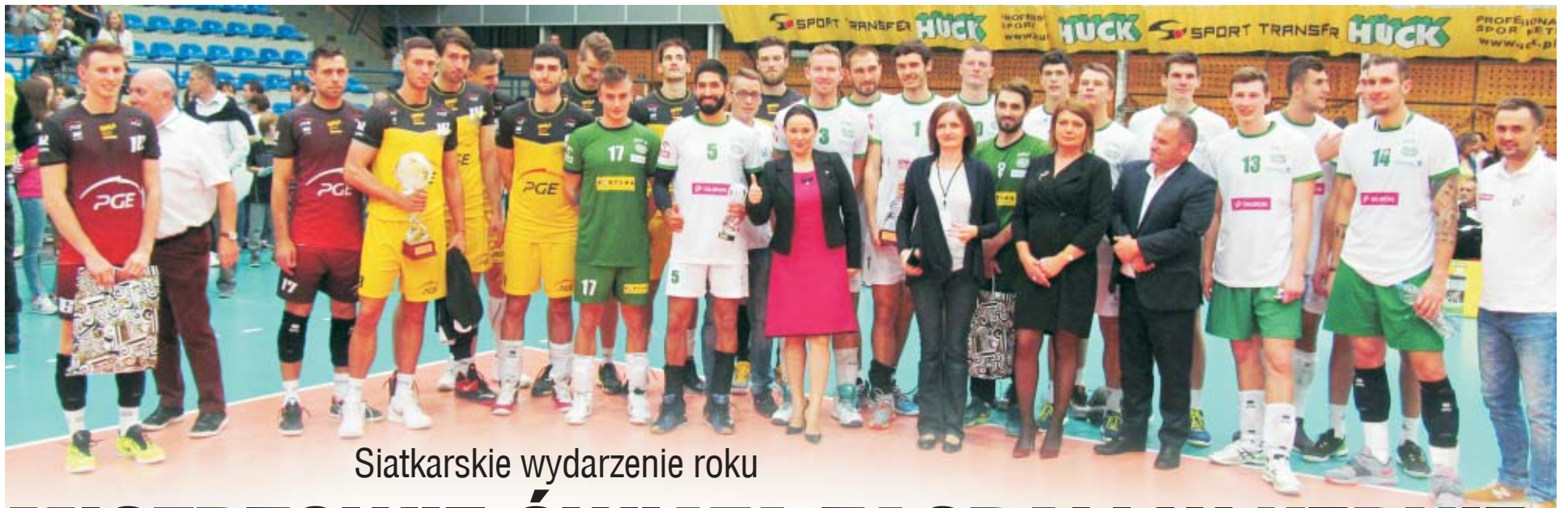
Siatkarskie wydarzenie roku