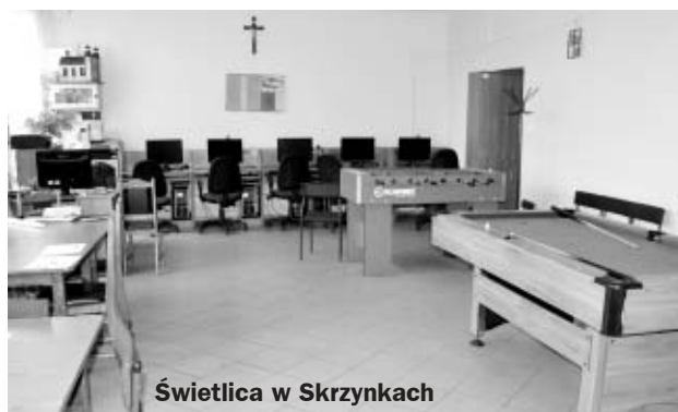
Świetlica w Skrzynkach