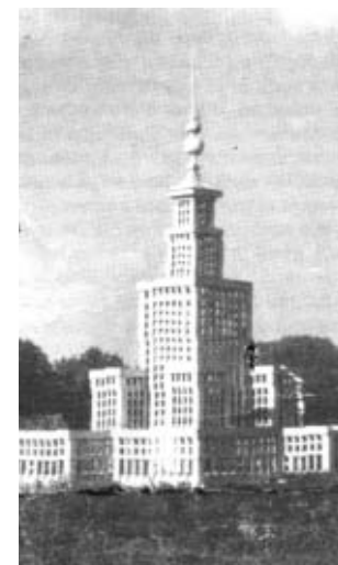
Pałac Kultury i Nauki replika w Ostrzeszowie

Oddanie do użytku placu zabaw dla dzieci nastąpiło dnia 22 lipca 1964 r. Po 20-tu latach, w 1984 roku, podczas jubileuszu 70-lecia Związku Harcerstwa