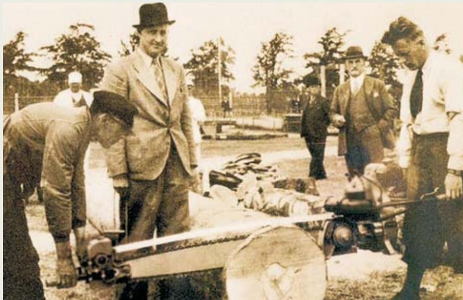
Pilarka STIHL na wystawie w Lipsku 1930 r.

W dzisiejszym dodatku „Leśnych Wieści” chcemy czytelnikom przybliżyć zawód, który jak chyba żaden inny tak jednoznacznie identyfikowany jest z lasem.