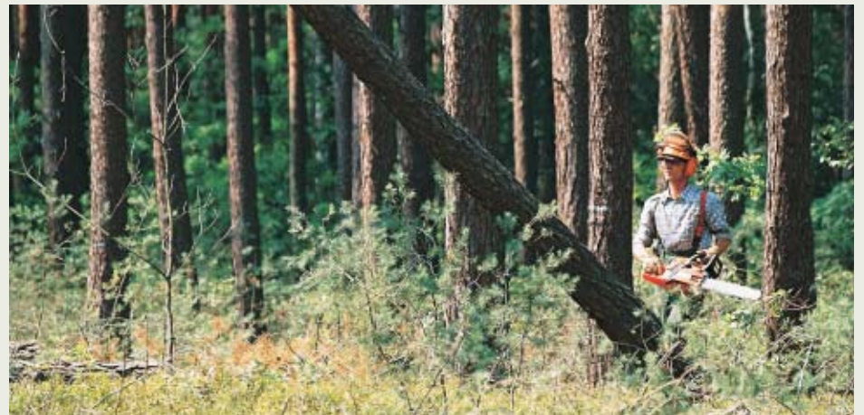
Praca na zrzebie

Ktoś kiedyś powiedział, że gdyby w dzisiejszych czasach wymyślono pilarkę z odsłoniętym i niezabezpieczonym narzędziem tnącym żadna służba nadzoru bhp nigdy nie dopuściłaby jej do użytku. Dlaczego więc nadal pilarka jest w użyciu jako podstawowy sprzęt do przerzynki drewna. Chyba tylko dla tego, że do tej pory nikt nie wymyślił nic lepszego. W dzisiejszych urządzeniach zwraca się szczególną uwagę na bezpieczeństwo i ochronę środowiska. Pomimo to jednak, zawód drwała zaliczany jest na całym świecie do zawodów bardzo ciężkich i niebezpiecznych. Zima, lato, deszcz lub śnieg, szereg zagrożeń środowiskowych. Nie każdy jest w stanie wytrzymać długo w takich warunkach. Trzeba rzeczywiście zwy-