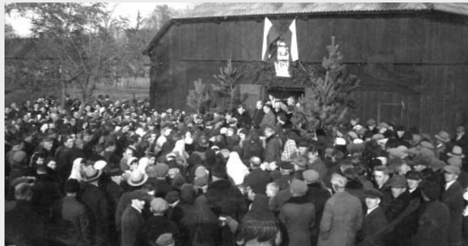
Otwarcie wystawy rolniczej Katolickiego Stowarzyszenia Młodzieży i Z. S. (?) w sali straży pożarnej w Kraszewicach dnia 4 XI 1934 r. Dziś teren sklepu Polo.

Z - Zaprosniarki - zespół obrzędowy istniejący od 1987 roku; powstał z inicjatywy Bożeny Zadki mającej folklor we krwi; grupa kulturuje lokalne tradycje i zwyczaje, prezentując barwne widowiska o dawnym życiu regionu. Do wielokrotnie nagradzanych na ogólnopolskich przeglądach inscenizacji należą m.in. Wicie wianków na oktavę Bożego Ciała, Jak to ze Inem było, Wiejskie wesele, Kiszanie kapusty. Zespół tworzy też oprawę artystyczną lokalnych uroczystości - dożynek, świąt patriotycznych i kościelnych.