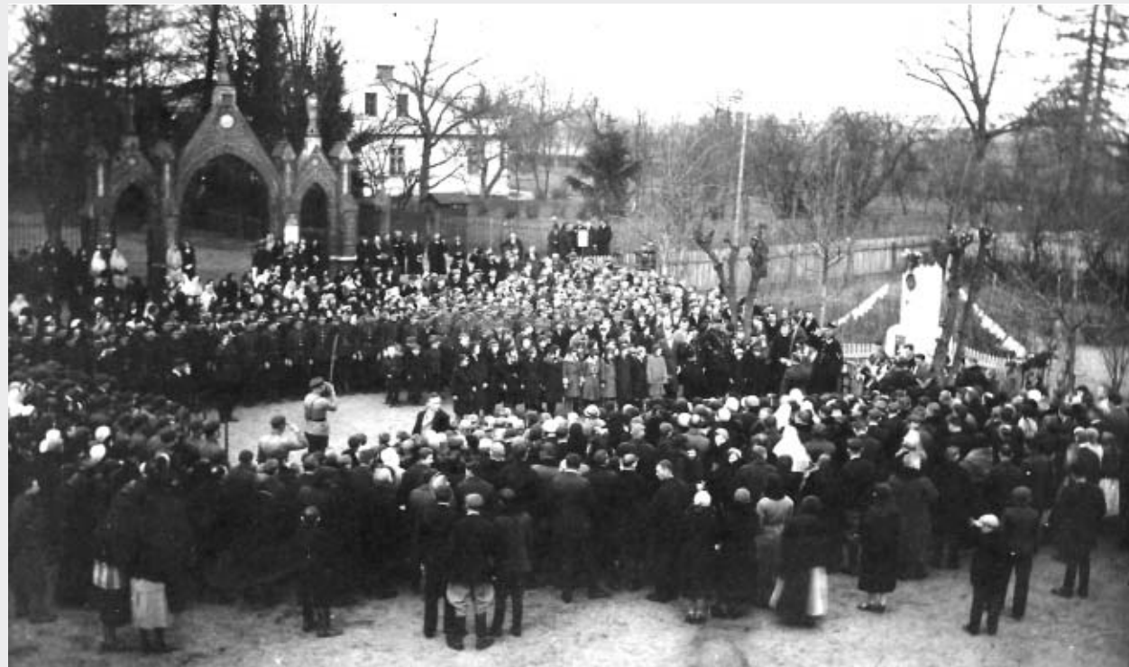
Uroczystość 19 marca 1934 r. (czyli imieniny Józefa Piłsudskiego) Plac przed kościołem i szkołą.