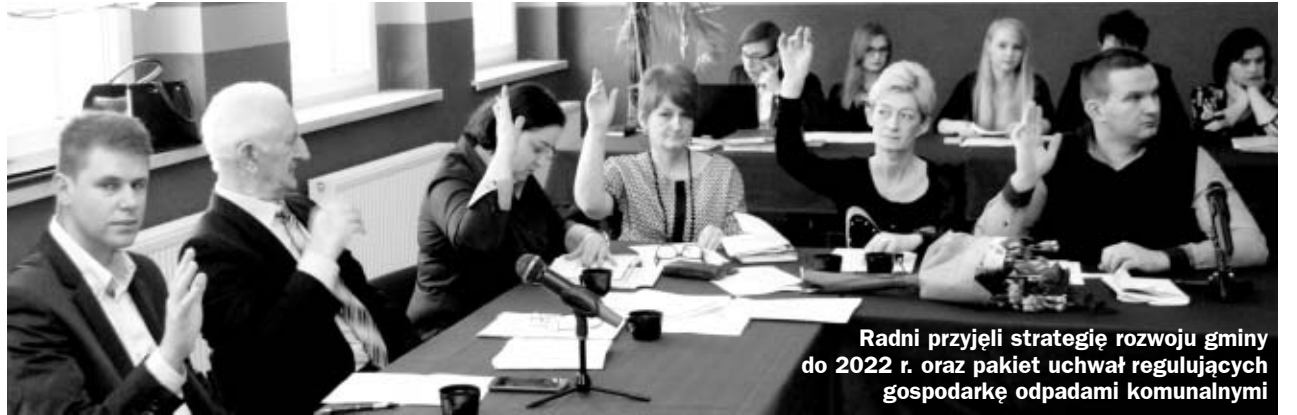
Radni przyjęli strategię rozwoju gminy do 2022 r. oraz pakiet uchwał regulujących gospodarkę odpadami komunalnymi