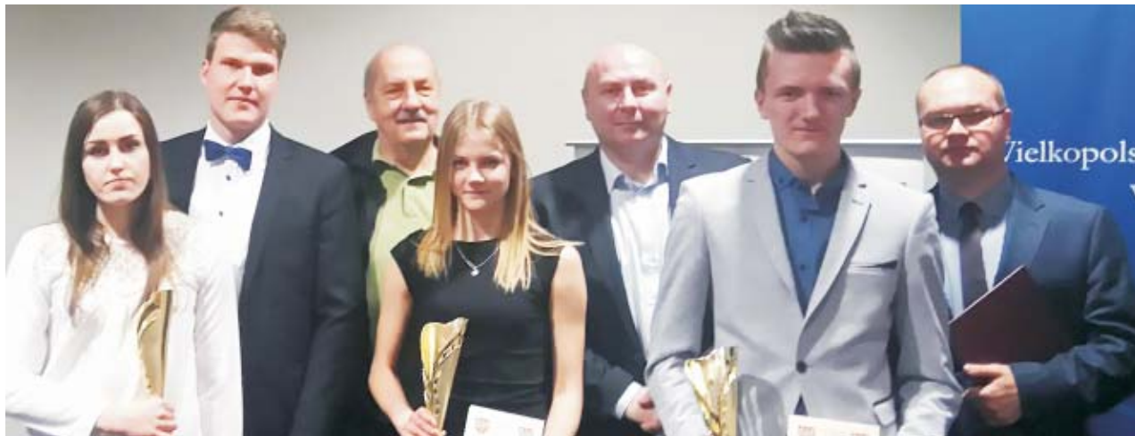
5 zawodników LKS Orkan Ostrzeszów znalazło się w czołowej dziesiątce poszczególnych kategorii Konkursu Nadziei Olimpijskich im. Karola Hoffmanna.