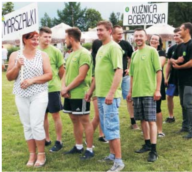
W minioną niedzielę w Marszałkach odbył się VII Turniej Sołectw o Puchar Burmistrza Miasta i Gminy Grabów nad Prosną.