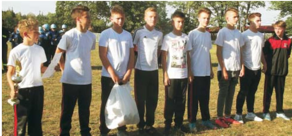
Niespodzianką niedzielnych Gminnych Zawodów Sportowo - Pożarniczych

w Kuźnicy Grab. było podwójne zwycięstwo, jakie w kategorii Młodzieżowych Drużyn Pożarniczych osiągnęli gospodarze zawodów. Jednak w najbardziej obleganej grupie męskiej bezkonkurencyjną okazała się OSP Głuszyna.