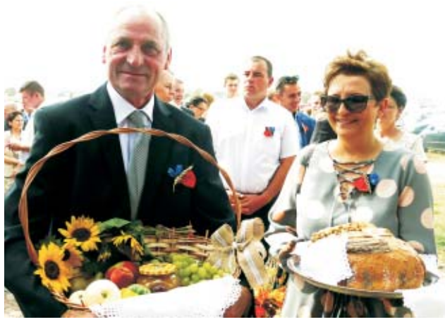
W minioną sobotę w Mnichowicach obchodzono dożynki oraz Święto Gminy Bralin.