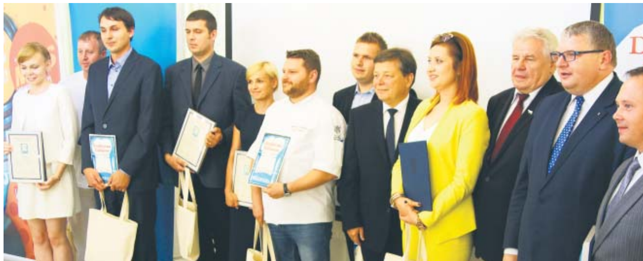
Nowi członkowie Sieci Dziedzictwa Kulinarnego Wielkopolska

Przykład Sieci Dziedzictwa Kulinarnego Wielkopolska pokazuje, że sukces w branży spożywczej nie zawsze musi wynikać z innowacji, postępu technologicznego i produkcji na masową skalę. Dobry produkt może powstać również w tradycyjnych warunkach, na bazie dobrze znanych, choć często zapomnianych przepisów. Walory smakowe i zdrowotne tak wytworzonej żywności są dla konsumentów nie do przecenienia. Zachęcamy producentów rolnych, przetwórców żywności, których wyroby powstają na bazie wielkopolskich surowców, a także restauracje, lokalne sklepy, które w swojej ofercie proponują wielkopolską, naturalną żywność, do przystąpienia do Sieci Dziedzictwa Kulinarnego Wielkopolska. Aby zostać członkiem Sieci, należy złożyć wniosek do Departamentu Rolnictwa i Rozwoju Wsi Urzędu Marszałkowskiego Województwa Wielkopolskiego w Poznaniu. Naprawdę warto!