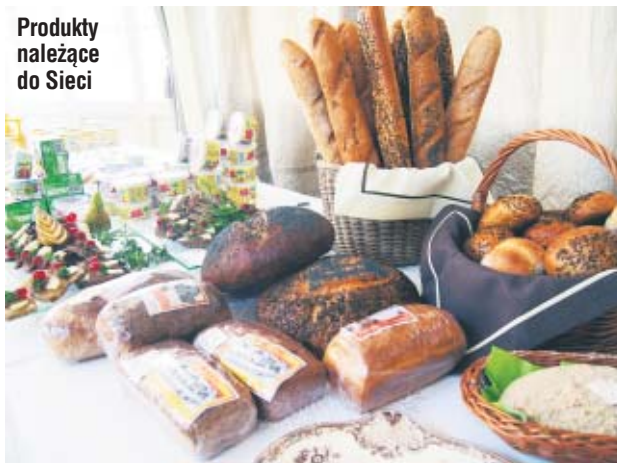
Produkty należące do Sieci