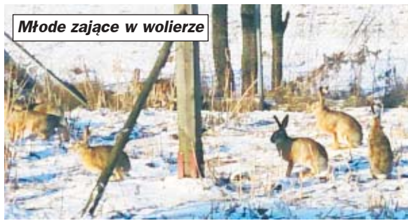
Młode zajęc w woli