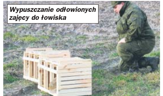
Wypuszczanie odłowionych zajęc do łowiska