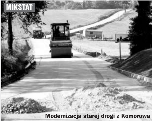
Modernizacja starej drogi z Komorowa

Do końca września mają być gotowe kolejne dwie drogi w gminie Mikstat, na które samorząd mikstacki pozyskał 181.000 zł dofinansowania z budżetu samorządu województwa wielkopolskiego.