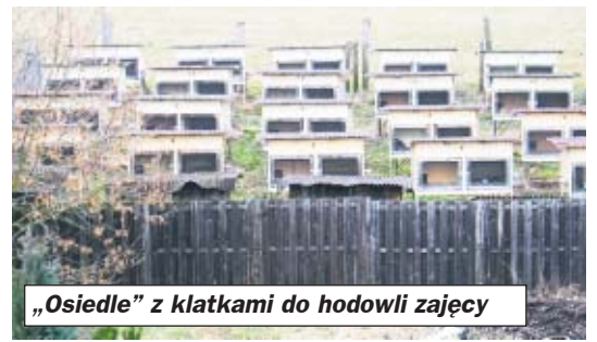
„Osiedle” z klatkami do hodowli zajęc