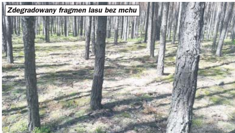
Zdegradowany fragmen lasu bez mchu

i 153 Kodeksu Wykroczeń zagrożone jest karą grzywny do 250 zł). Jeśli jednak uznamy, że nadzór i sankcje dotyczą tylko Strąży Leśnej, pustoszenie lasów jesienią i w okresach przedświątecznych będzie się rozwijać na naszych oczach z naszym cichym przyzwoleniem. W nadleśnictwach stroisz można kupić nie tylko legalnie, ale i taniej, bez pośredników, a powszechne zainteresowanie bazarową ofertą na pewno ograniczy zapędy entuzjastów łatwego zarobku. Sprawa świątecznych drzewek i gałęzi jest już w dużym stopniu uregulowana. Znacznie gorzej wygląda problem zrywania kory z drzew i pozyskiwania mchu, równie „łakomego kąsku” dla złodziei, producentów okolicznościowych dekoracji i coraz popularniejszych elementów tzw. wystroju wnętrz. Można je zobaczyć w biurach, sklepach, kawiarniach, restauracjach, salonach fryzjerskich, gabinetach, na korytarzach i na stolikach w poczekalni. Upiększają przestrzeń i poprawiają nastrój, dlatego nie myślimy ani o ich pochodzeniu, ani o lesie, w którym rosły. Warto wiedzieć, że mszaki są uznawane za jedne z najstarszych żyjących obecnie roślin lądowych. Pojawiły się wiele milionów lat temu - na przełomie dewonu i karbonu. Dzięki temu, że nigdy nie były organizmami dominującymi, nie dotknęły ich zmiany klimatyczne i inne czynniki mające znaczący wpływ na ewolucję. Przez miliony lat uległy jedynie małym zmianom. Ich