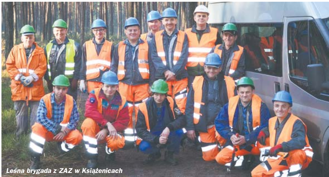
Leśna brygada z ZAZ w Książenicach