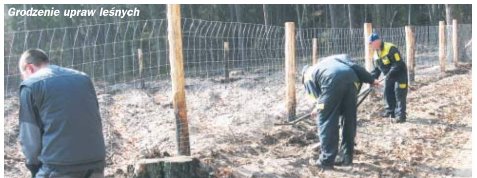
Grodzenie upraw leśnych