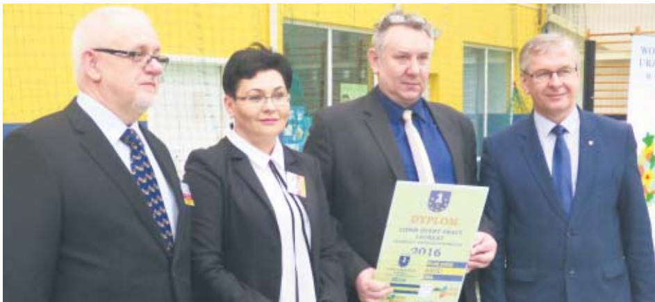
Przyznano także statuetkę Lider Ofert Pracy 2016. Trafiła ona do rąk właściciela firmy Wyroby Garmażeryjne Zaród z Kobylej Góry.

- Firmy przede wszystkim szukają ślusarzy, spawaczy itp. Rozmawiałem z jedną z agencji zatrudnienia, której przedstawiciele powiedzieli mi, że byłoby usatysfakcjonowani gdyby zabrali ze sobą dwóch spawaczy do Niemiec, zatrudnienie