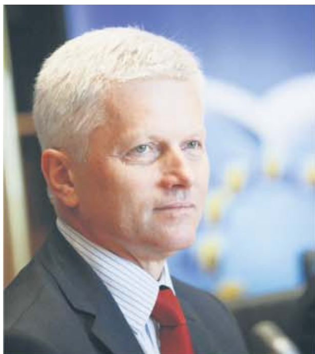
Andrzej Grzyb Poseł do Parlamentu Europejskiego