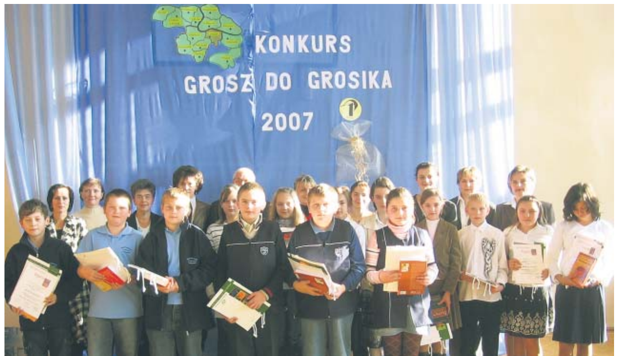
Laureaci I edycji konkursu Grosz do Groszika 2007. Organizatorem była Szkolna Kasa Oszczędności przy Szkole Podstawowej w Lututowie wspólnie z Bankiem. W konkursie tym wzięło udział 31 szkół podstawowych. Zwycięzcy otrzymali dyplomy oraz nagrody książkowe ufundowane przez Rejonowy Bank Spółdzielczy w Lututowie