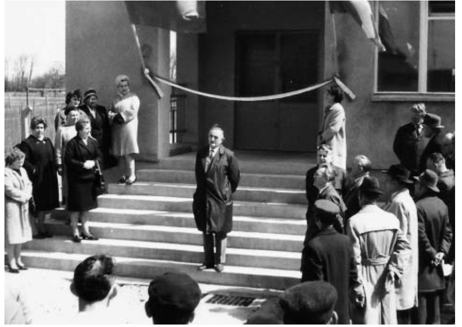
Uroczyste otwarcie siedziby Banku przy ulicy Klonowskiej 6 w 1967 roku

W 1924 roku dokonano zmiany nazwy Towarzystwa na Spółdzielnię Ludową z Odpowiedzialnością