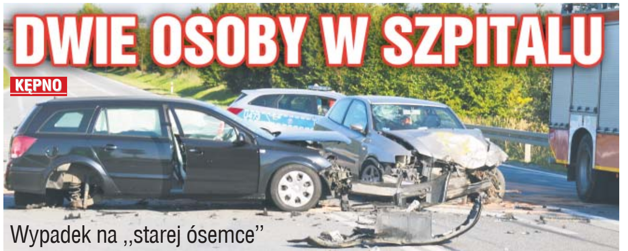
Wypadek na „starej ósemce”

Dwie osoby ze złamaniami i innymi urazami w szpitalu. To efekt wypadku, do którego doszło w pobliżu restauracji McDonalds w Kępnie.