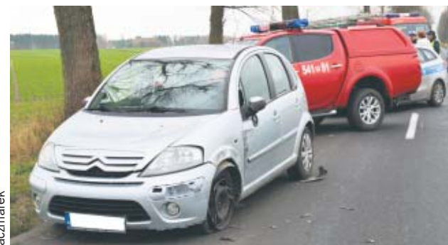
Fot. Wiesław Kaczmarek