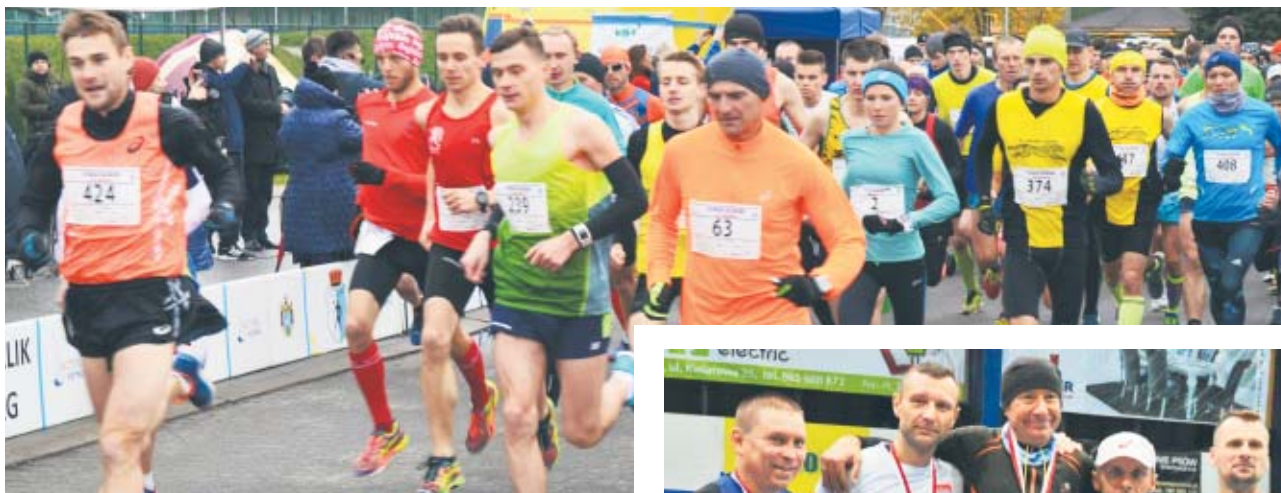
Fot. Wiesław Kaczmarek