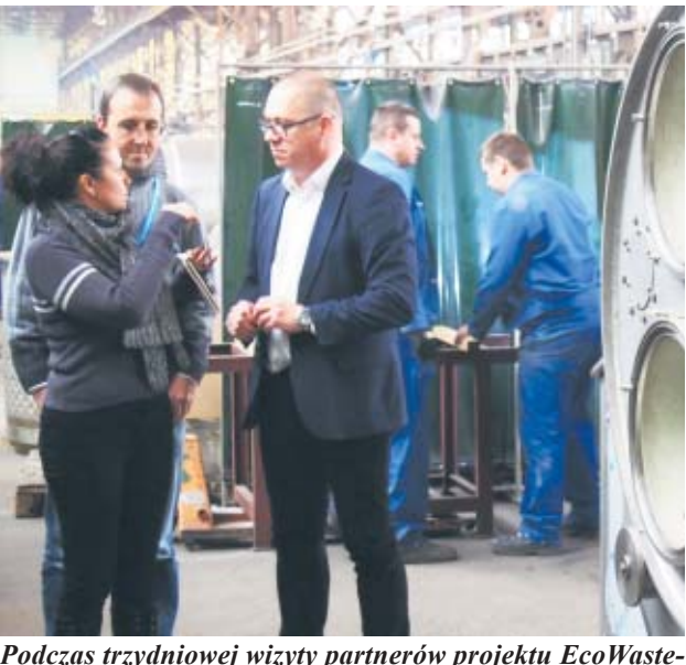
Podczas trzydniowej wizyty partnerów projektu EcoWaste4Food w Wielkopolsce odwiedzili m.in. Fabrykę Maszyn Spożywczych SMOMASZ w Pleszewie