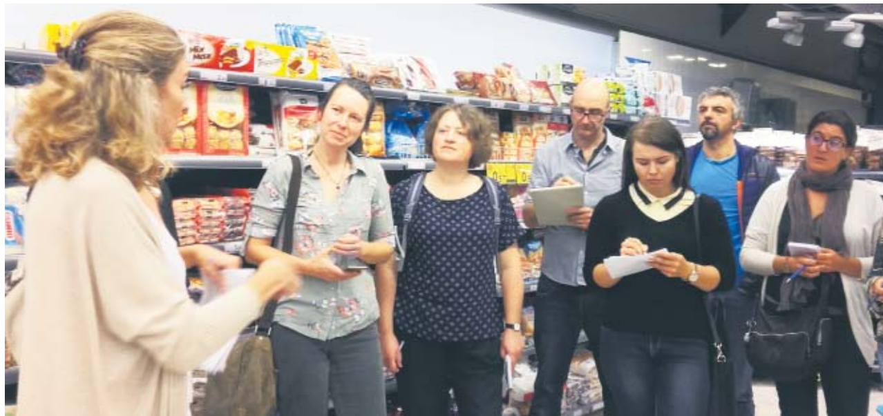
Hiszpański region Katalonia pokazał jak radzi sobie z problemem marnowania żywności