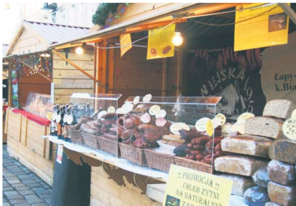
Niestety w okresie świątecznym marnujemy najwięcej jedzenia

Przed nami okres świąteczny. To dla nas wszystkich zawsze czas szczególnie. Wspólnie zasiadamy do obficie zastawionego stołu, żeby razem spożywać przygotowane wcześniej dania i cieszyć się wspólnie spędzonym czasem. Niestety, dużo zrobionego wcześniej jedzenia trafi do śmietnika. Jednak wcale nie musi tak się stać! Przede wszystkim świadomie planujmy nasze zakupy, policzmy ilość osób, z którymi zasiądziemy do wspólnego stołu czy wybierzmy produkty, które dłużej zachowają swoją świeżość. A po Świątach? Potrawy, które pozostały przechowujemy odpowiednio, żeby jak najdłużej zachowały swoją przydatność. Albo... podzielmy się jedzeniem z innymi - rodziną, sąsiadami, znajomymi czy potrzebującymi. To nic nas nie kosztuje.