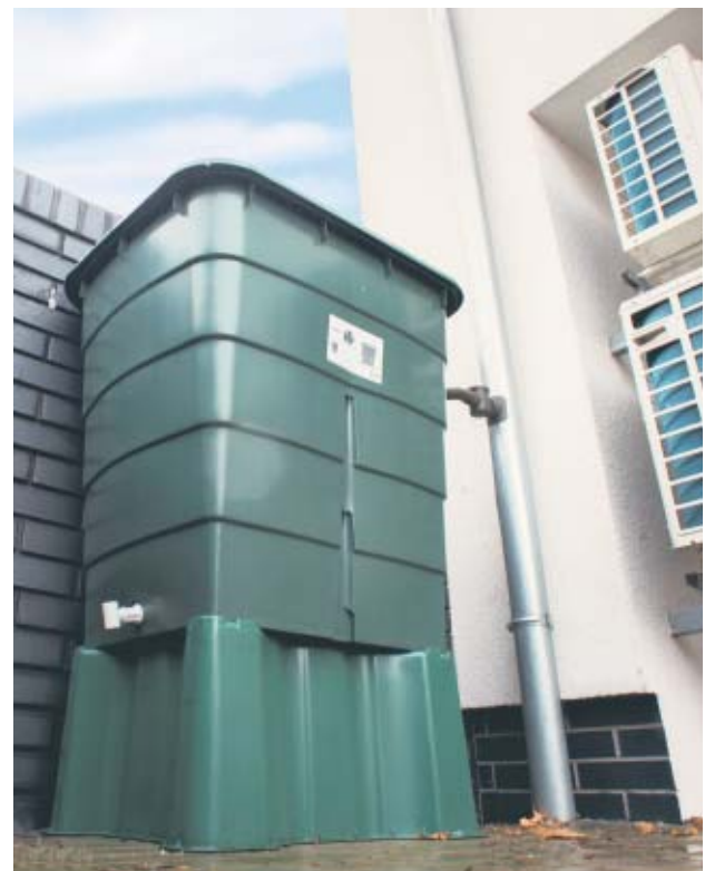
Zbiornik naziemny przy Budynku Tradycji w Godzieszach Wielkich, zrealizowany w ramach zadania pn. Wykorzystanie wody opadowej w celu nawadniania zieleni przy Budynku Tradycji w Godzieszach Wielkich.