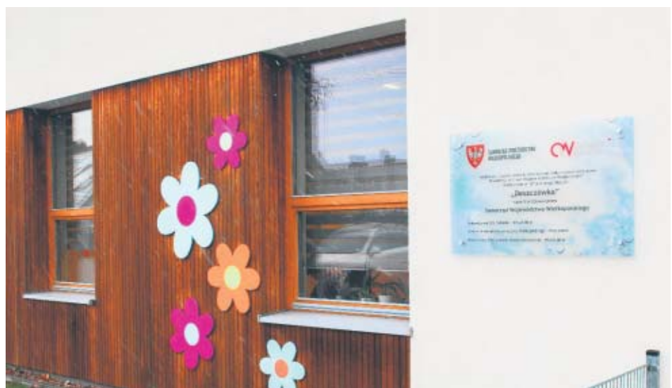
Tablica informacyjna na budynku Przedszkola „Jaś i Małgosia” w Ostrowie Wielkopolskim, zrealizowana w ramach zadania pn. Budowa zbiornika retencyjnego wody opadowej na terenie Przedszkola nr 3 „Jaś i Małgosia” w Ostrowie Wielkopolskim