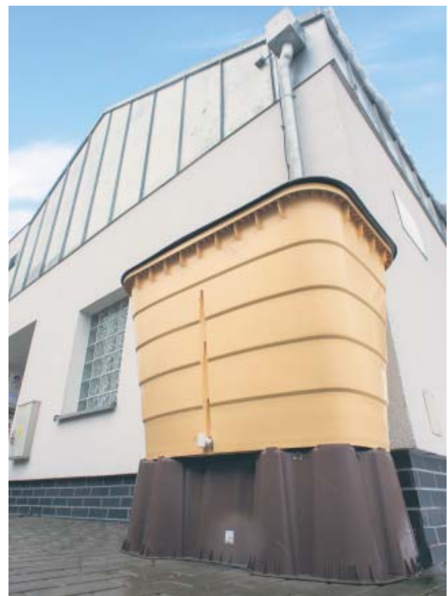
Zbiornik naziemny przy Budynku Tradycji w Godzieszach Wielkich, zrealizowany w ramach zadania pn. Wykorzystanie wody opadowej w celu nawadniania zieleni przy Budynku Tradycji w Godzieszach Wielkich.

Wnioski można składać osobiście w siedzibie Urzędu Marszałkowskiego Województwa Wielkopolskiego w Poznaniu przy al. Niepodległości 34, 61-714 Poznań, za pośrednictwem poczty tradycyjnej lub przy pomocy platformy ePUAP.