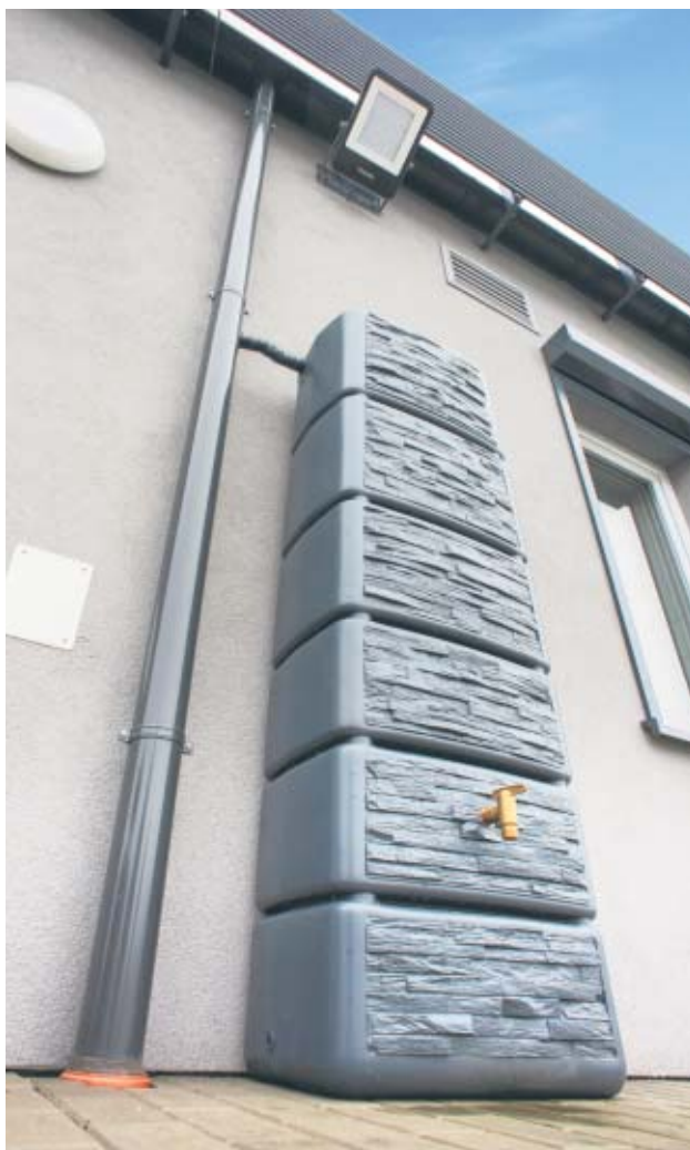
Zbiornik naziemny przy przedszkolu „Justynka” w Stawiszynie, zrealizowany w ramach zadania pn. Wykonanie systemu magazynowania wody opadowej przy Przedszkolu Samorządowym w Stawiszynie

Podczas dwóch dotychczas zrealizowanych edycji programu pn. „Deszczówka” beneficjenci najczęściej umieszczali zbiorniki przy placówkach edukacyjnych - szkołach lub przedszkolach. Ponadto instalacje pozwalające na zbieranie wody deszczowej pojawiły się także przy obiektach o charakterze kulturalnym: bibliotekach, domach kultury, świetlicach wiejskich oraz przy szpitalach. Najczęściej wskazywane obszary