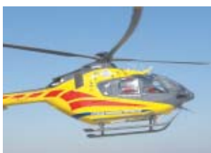
nach porannych na terenie jednego z zakładów pracy

30-letni mieszkaniec Grabowa doznał urazu nóg. Do wypadku doszło na terenie jednego z zakładów pracy w Giżycach. Mężczyzna został przetransportowany do szpitala.