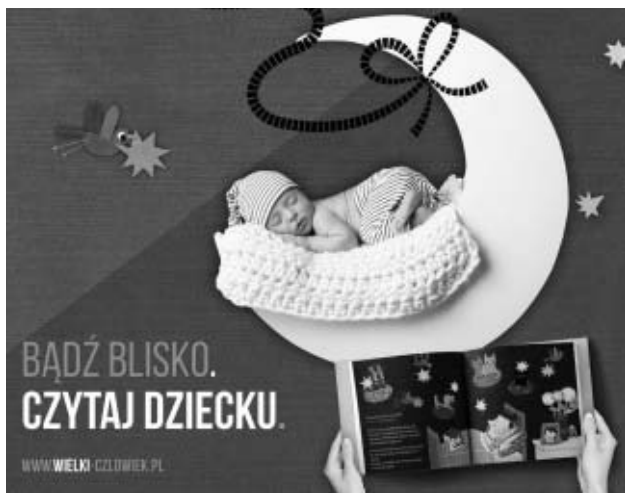
zycznej wypożyczeniem przynajmniej jednej książki z księgozbioru dziecięcej, Mały Czytelnik otrzyma naklejkę do bibliotecznej karty, a po uzyskaniu dzie-

Już od września br. każdy trzylatek, który odwiedzi bralińską bibliotekę otrzyma Wyprawkę Czytelniczą a w niej książkę „Pierwsze wiersze dla...” oraz Kartę Małego Czytelnika do zbierania bibliotecznych naklejek. W pakiecie startowym znajdzie się także broszura dla rodziców „Książką połączeni, czyli o roli czytania w życiu dziecka”. Podczas wizyty w bibliotece zakoń-