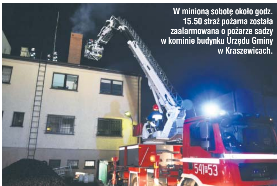
W minioną sobotę około godz. 15.50 straż pożarna została zaalarmowana o pożarze sadzy w kominie budynku Urzędu Gminy w Kraszewicach.

Wydobywający się z kominą ogień zauważyła jedna z sąsiadek i to ona zaalarmowała straż pożarną. Przed urzędem niemal natychmiast pojawili się strażacy z miejscowej jednostki OSP, chwilę później dotarł tam wóz bojowy OSP Głuszyna. Na miejsce skierowano też zastęp JR-G PSP w Ostrzeszowie oraz podnośnik, za pomocą którego strażakom udało się dotrzeć do - usadowionego na dachu 1-piętrowego budynku - kominia.