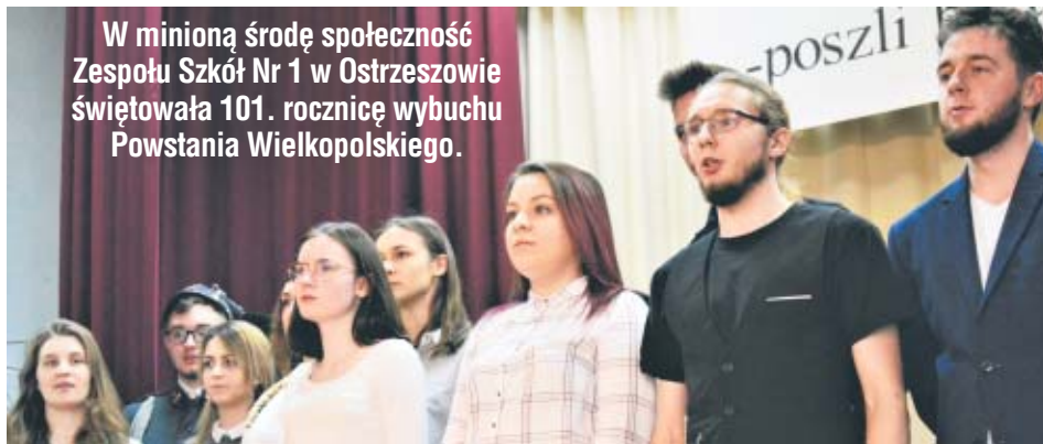
W minioną środę społeczność Zespołu Szkół Nr 1 w Ostrzeszowie świętowała 101. rocznicę wybuchu Powstania Wielkopolskiego.

W minioną środę uczniowie oraz zaproszeni goście - przedstawiciele samorządu powiatu ostrzeszowskiego, samorządu miasta i gminy Ostrzeszów, parlamentarzyistów oraz zaprzyjaźnionych placówek oświatowych, a przede wszystkim potomkowie powstańców - zbrali się przed szkołą, by oddać hołd Powstańcom i złożyć kwiaty pod pamiątkowym pomnikiem. W imieniu samorządu powiatowego białoczerwoną wianką złożył ostrzeszowski starosta