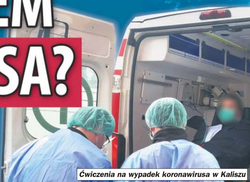
Ćwiczenia na wypadek koronawirusa w Kaliszu